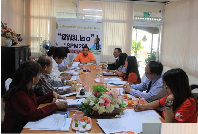
การจัดทำรายงานวิเคราะห์ความเสี่ยงเกี่ยวกับการปฏิบัติงานที่อาจเกิดผลประโยชน์ทับซ้อน