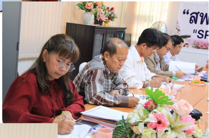
การจัดทำแผนปฏิบัติการป้องกันและปราบปรามการทุจริต